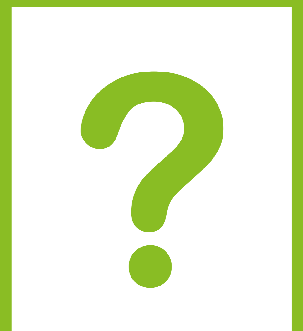
Du (ab März 2019)