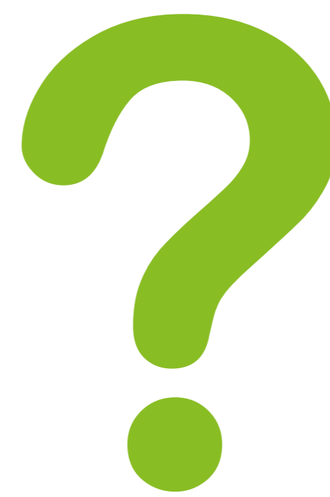
Du (ab März 2019)